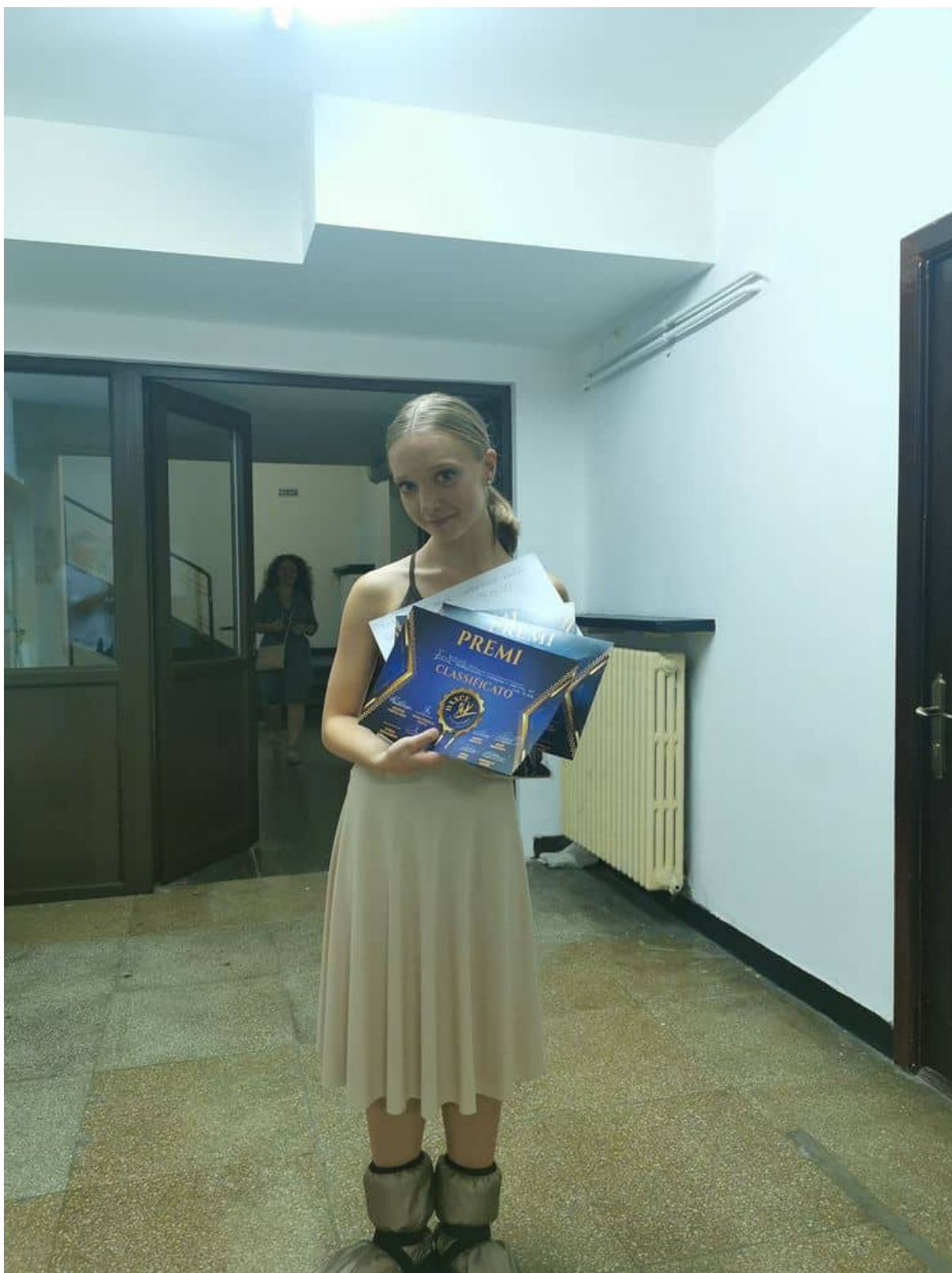
Po tekmovanju Dance Campus Bucharest, 2021

Se aktivno udeležuješ tudi tekmovanj? Kje vse si že bila in na katere uvrstitve, ki si jih osvojila pa si najbolj ponosna in zakaj?