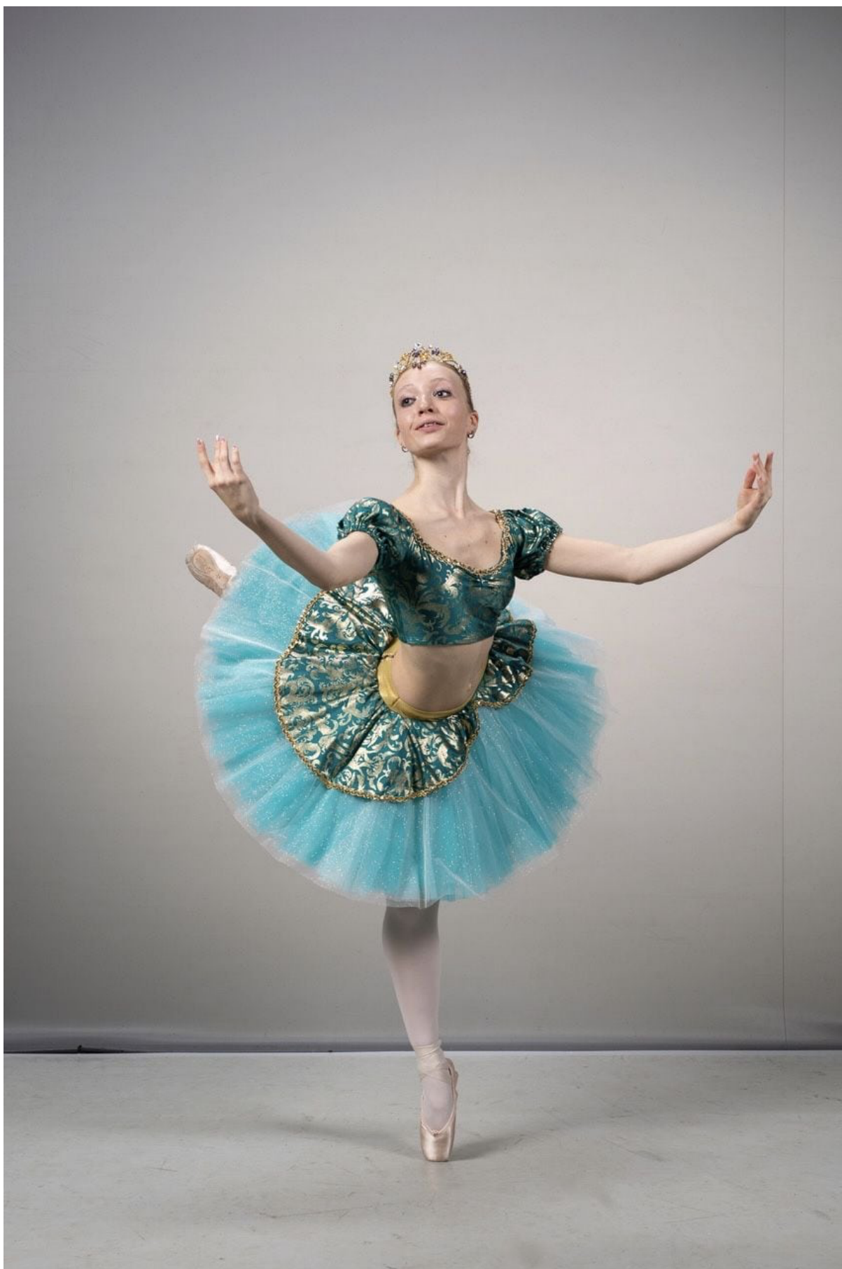
Promocijska fotografija za prihajajoče tekmovanje Baltek 2024