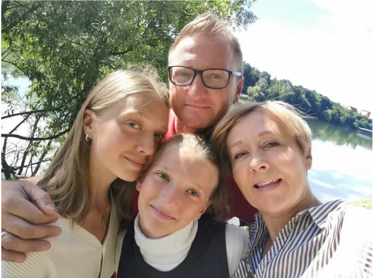
Družinski portret

Ime je redko, izbral pa ga je moj oče. V bistvu je kitajsko in v slovenščini pomeni 'najdražja'. To, ali pa me opisuje pa morajo povedati drugi, jaz mislim, da mi pristaja.