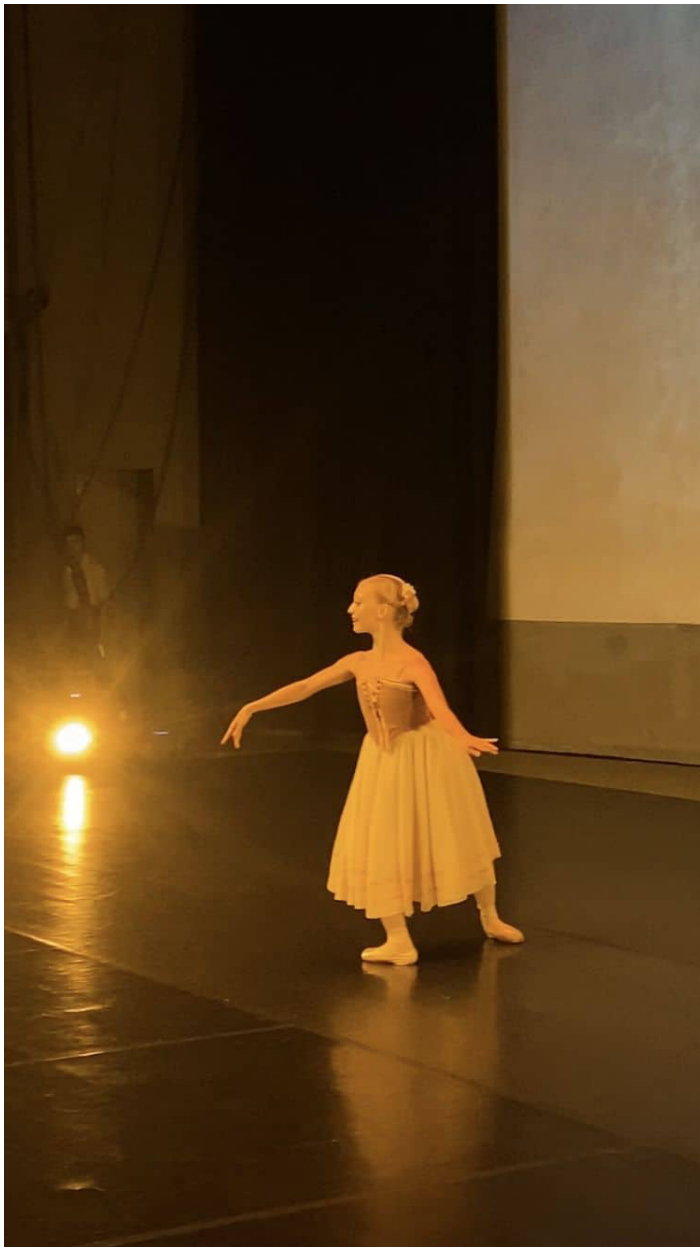
Variacija Lize (Navihanka) na gala koncertu Dancs Piran 2023