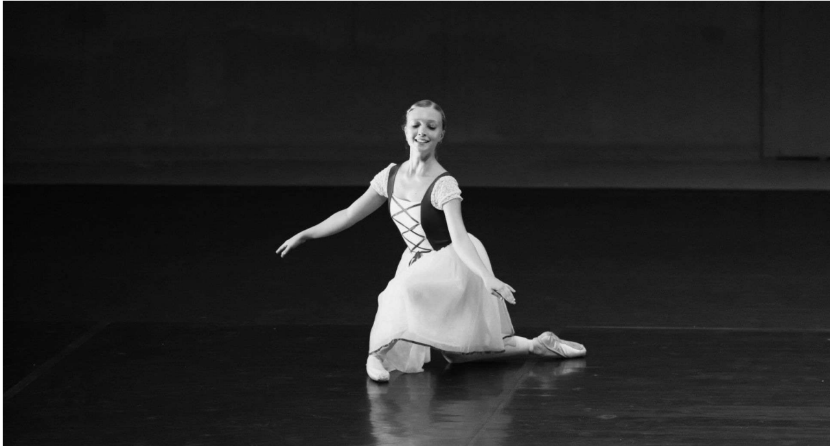
Variacija Giselle na gala koncertu Dancs Piran, 2022

When you feel like stopping, think about why you started (Ko se želiš ustaviti, pomisli, zakaj si začel.)